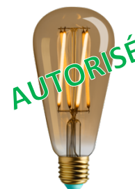
lampe à LED 100 lumens par watt 10 000 heures

Arrivée à maturité, la LED offre aujourd'hui une aussi grande variété de design et la même qualité de lumière. L'efficacité lumineuse est très supérieure et la durée de vie plus longue.