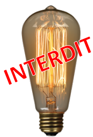
lampe à filament 5 lumens par watt 2000 heures

Appréciables pour leur lumière chaude à la teinte presque orangée, leurs formes originales et variées, ces lampes étaient souvent choisies pour leur aspect décoratif.